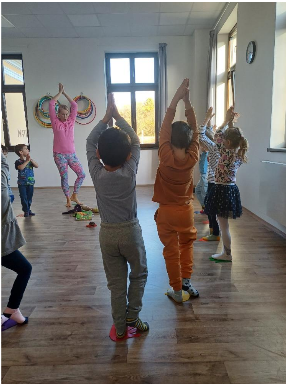
Celorepublikový projekt Se Sokolem do života, aneb svět nekončí za vrátky, cvičíme se zvířátky